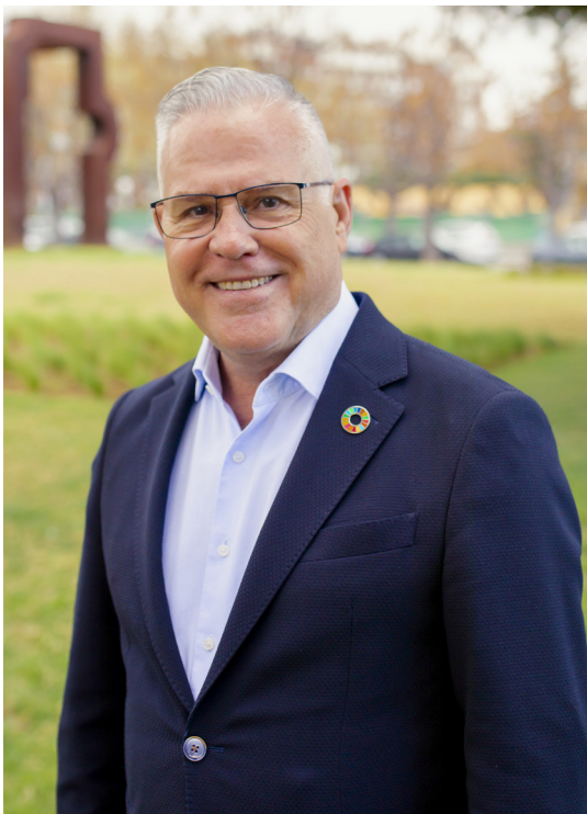
Pere Granados Carrillo Alcalde de Salou